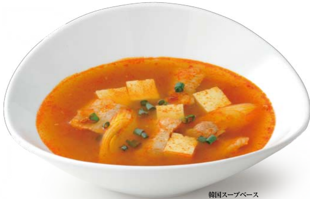
韓国スープベース