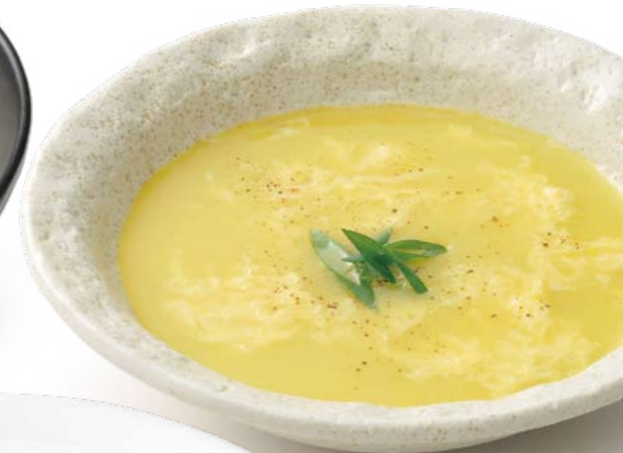
中華コーンスープベース