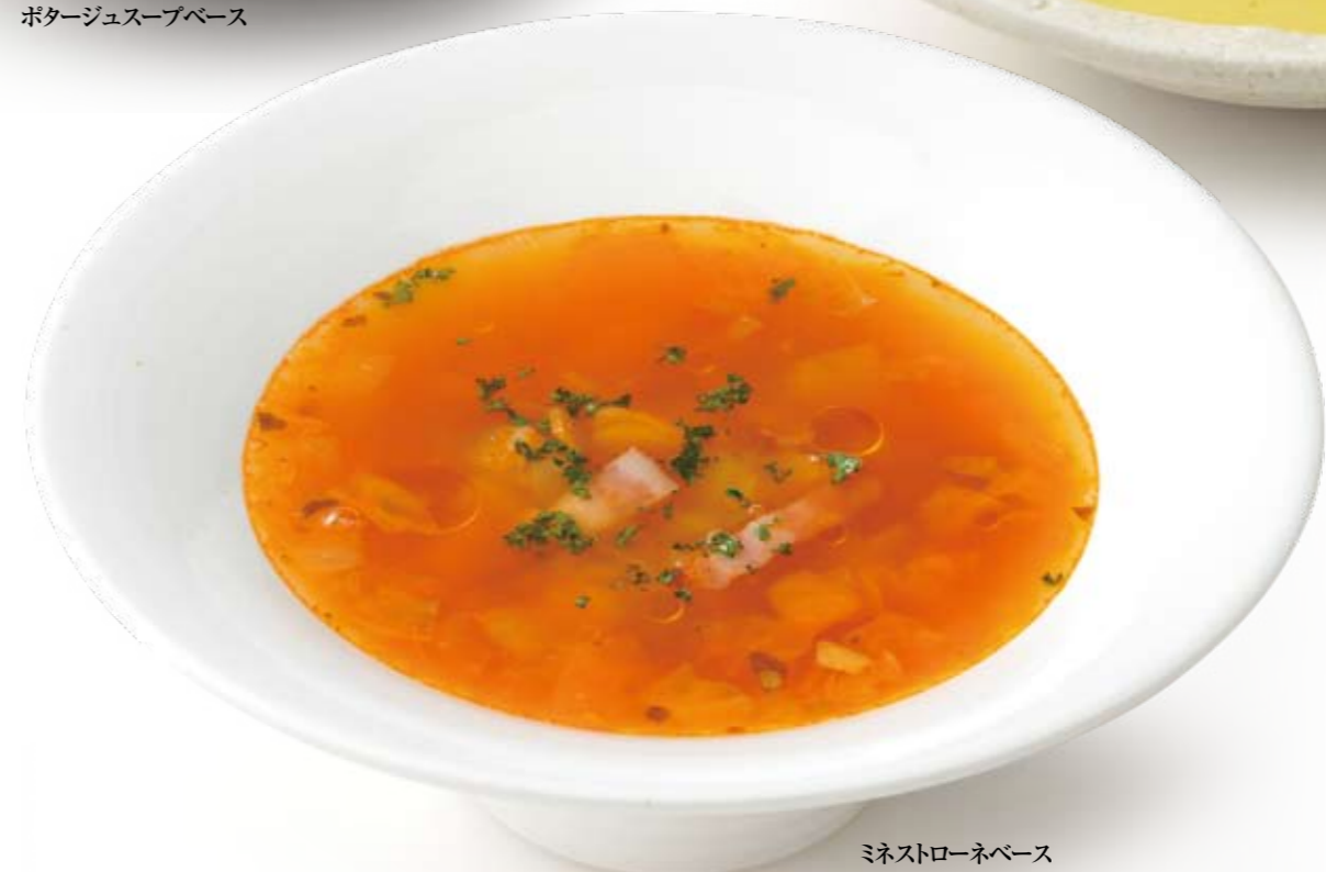
ミネストローネベース