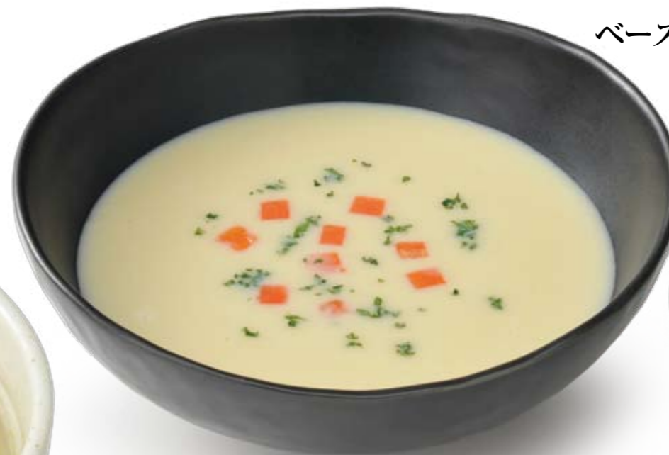
ポタージュスープベース