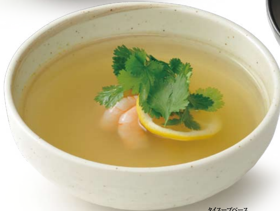
タイスープベース